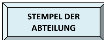
Stempel der Abteilung