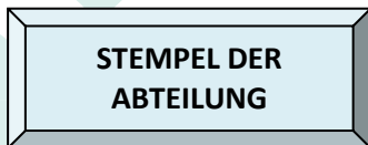
Stempel der Abteilung

Blaue Felder sind vom Mentor/von der Mentorin auszufüllen!